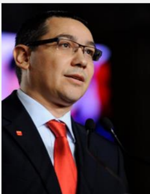
Victor Ponta, premier Rumunii.

Nasz udział w budowie nowej Rumunii wydaje się konieczny!